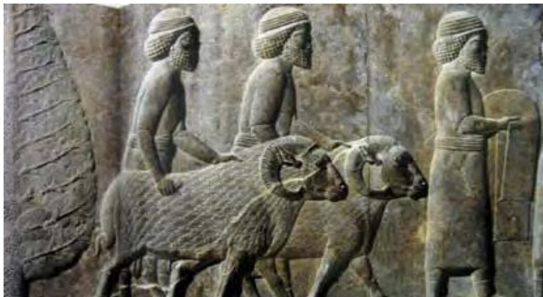
تصویر (۲) - آورندگان هدایا در تخت جمشید، پلکان شرقی کاخ آپادانا، سمت چپ درخت سرو

نقوش مکرر درخت و گل در تخت جمشید نشان از علاقه به گل و گیاه در آیین هخامنشیان دارد سرو نماد اهورامزدا، نخل نماد میترا و نیلوفر نماد آنهاپتا است که در مکان های مخصوص در تخت جمشید حجاری شده و بازگو کننده اعتقاد و احترام آنها به این هدیه اهوایی است و در دو پلکان بزرگ آپادانا هر دسته از افراد را نشان می دهد که به وسیله درخت سروی جدا شده اند (سعیدی، ۱۳۷۶).