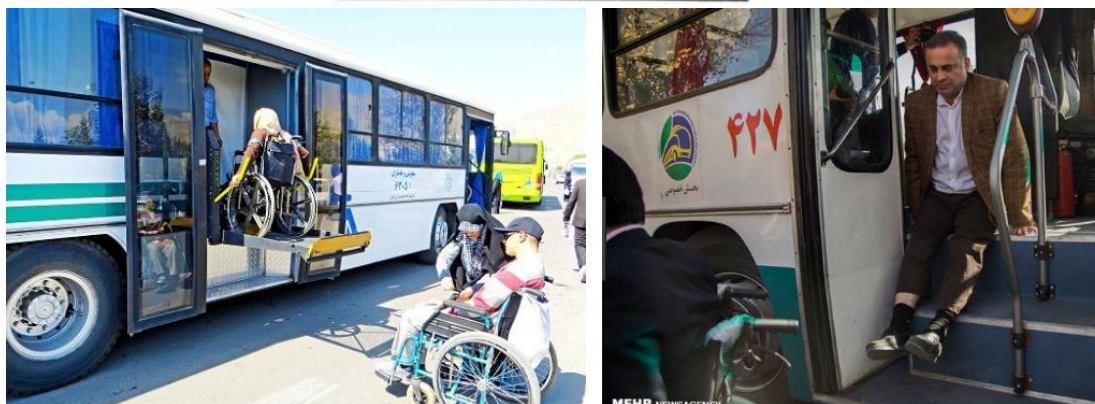
تصویر ۱- چند نمونه از مسائل و مشکلات و طرح‌های مناسب‌سازی