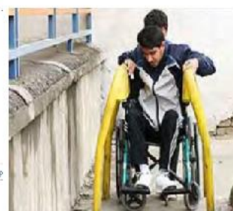
تصویر ۱- چند نمونه از مسیرهای نامناسب جهت عبور معلولین